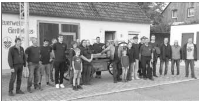
Die Delegation der Feuerwehrkameraden