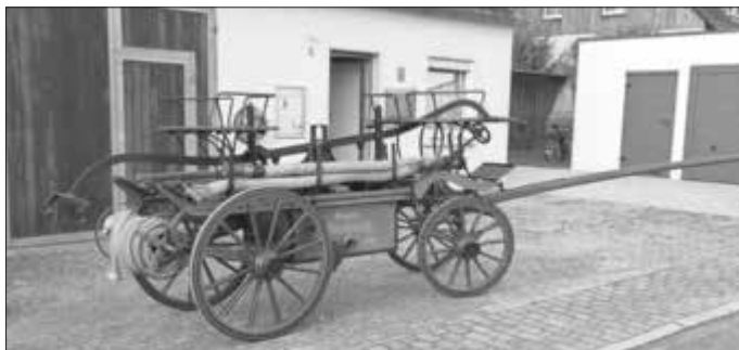
Die Mönchsrother Feuerwehrspritze von 1907

Am Freitag, 6. Oktober 2023, anlässlich des monatlichen Stammtisches, machten sich ca. 20 Feuerwehrkameraden aus Mönchsroth mit Ihrer alten Feuerwehrspritze aus dem Jahr 1907 auf den Weg nach Wittenbach. Nach gut einer halben Stunde Fußmarsch trafen sie gegen 18.30 Uhr am Museum in Wittenbach ein, wo sie von einigen Wittenbachern sowie der Mönchsrother Bürgermeisterin Frau Edith Stumpf willkommen geheißen wurden.