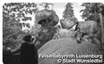
Felsenlabyrinth Luisenburg

Deutsches Fahrzeugmuseum Mehr als nur ein Automuseum: Automobil-Klassiker, Traumaautos, Prototypen, Rennsportwagen, Kleinwagen, Motorräder, Flugzeuge, Hubschrauber. Ein Muss für alle Autoliebhaber & Technikinteressierten. Nagler Weg 9-10, Fichtelberg