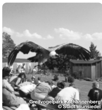
Greifvogelpark Katharinenberg

Fichtelberg Am wunderschönen Fichtelsee - im Herzen des Naturparks „Hohes Fichtelgebirge“ - liegt der staatlich anerkannte Luftkurort Fichtelberg. TreffpunktDeutschland.de/fichtelberg