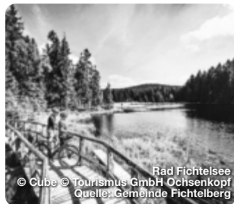
Rad Fichtelsee © Cube © Tourismus GmbH Ochsenkopf Quelle: Gemeinde Fichtelberg

großen Nachbarn der Metropolregion verstecken. Die hübsche historische Altstadt mit vielfältigen Shopping-Möglichkeiten, das Neue Schloss mit dem Hofgarten und, etwas außerhalb, die Eremitage sind Zeugnisse einer schillernden Vergangenheit. TreffpunktDeutschland.de/bayreuth