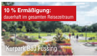
Kurpark Bad Füssing