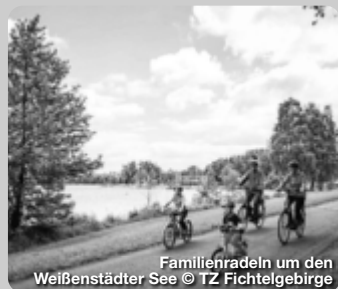
Familienradeln um den Weißenstädter See