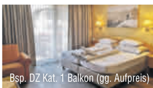
Bsp. DZ Kat. 1 Balkon (gg. Aufpreis)